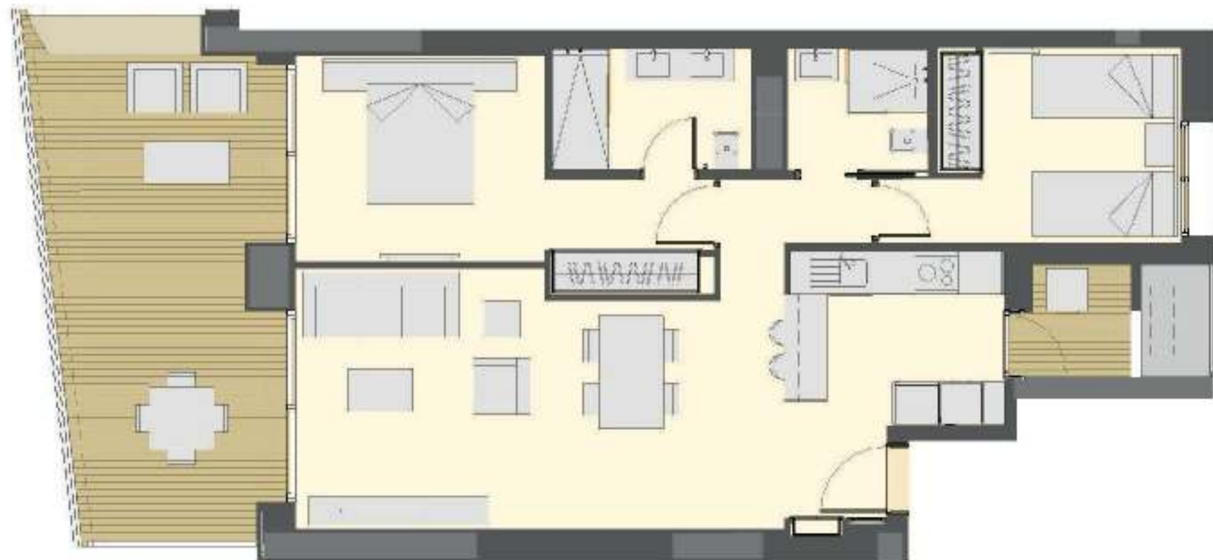
Apartamento 2 dormitorios + 2 Baños Apartment 2 Bedroom + 2 Bathroom.