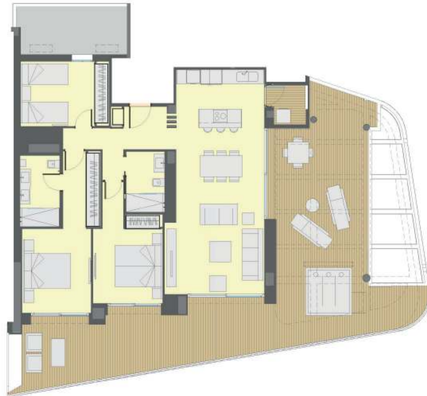
Apartamento 4 dormitorios + 2 Baños Apartment 4 Bedroom + 2 Bathroom.