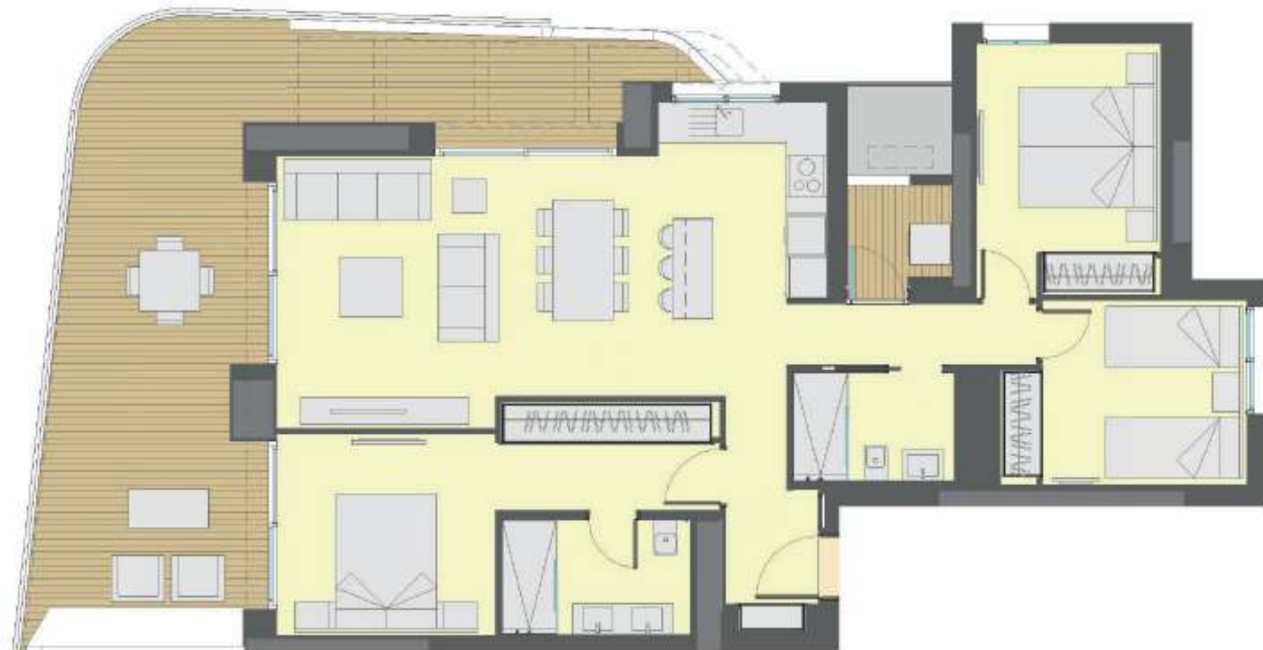
Apartamento 3 dormitorios + 2 Baños Apartment 3 Bedroom + 2 Bathroom.